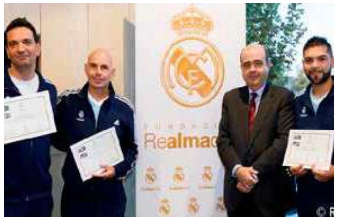
DERECHA: Autoridades de la Fundación Real Madrid junto con monitores deportivos de la OPM